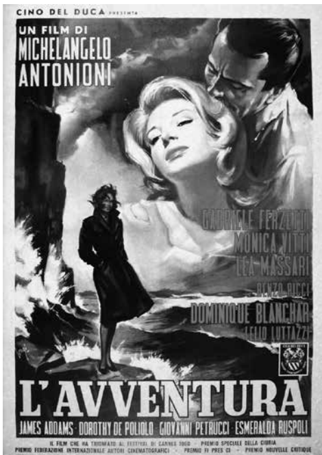
MICHELANGELO ANTONIONI L'avventura 1960

una belleza ya clásica como la de una carta del tarot. O bien, Viento en el viento u Hombre camión , robados a cantautores italianos de los años Setenta. A veces se trata de títulos de libros, como El vendaval y otras cosas de Eugenio Montale u Ojazos de madera de Carlo Ginzburg (a su vez tomado de un fragmento de Pi-nocchio ). O de películas, como Sobriety , Obesity and Growing Old de William Kentridge o L'avventura de Antonioni. En la lista hay un título que me gusta particularmente y que he extrapolado de la letra de una canción italiana: Una muchacha de Roma, cuyo rostro recuerda el colapso de una represa .