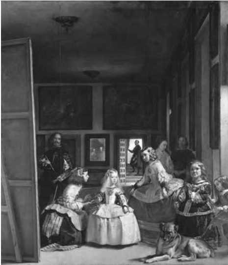
DIEGO VELÁZQUEZ Las Meninas 1656

artistas) sirve para clasificar al interior de una historiografía o de una serie de técnicas de representación. Se trata de un atributo externo a la obra: un suplemento. En los marcos aparece abajo, como una cartelera una leyenda (una “cosa para leer”). Un cuadro como La tempestad de Giorgione (1505 – 1508) debe mucho de su misterio a la dificultad de nominar el sujeto representado. Tal dificultad es testimoniada por la escogencia (posterior) del título, que parece indicar en la obra el primer paisaje de la historia del arte occidental.