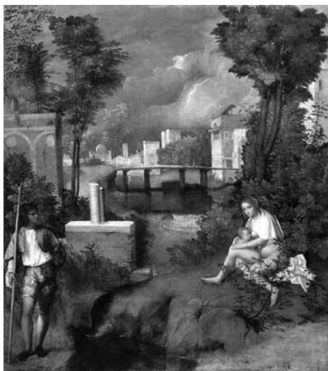
GIORGIONE La tempestad 505-1508

Numerosos críticos e historiadores de la música han hecho notar el gran malentendido en llamar Claro de luna a la Sonata para piano n. 14, Op. 27 n. 2 de Beethoven. Tal título no oficial, que se difundió después de la muerte del compositor, despistaría a la escucha de la sonata que, lejos de evocar un paisaje romántico, tendría más bien las características de una marcha fúnebre. Éste