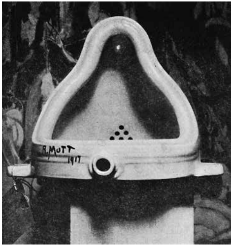
MARCEL DUCHAMP Fountain 1917

entre contenido y espectador, entonces la ausencia del título entra, necesariamente, a hacer parte de la obra. Por primera vez, el espacio (vacío) del título se convierte en un problema intrínsecamente estético, y esto es uno de los aspectos por los cuales Las meninas sería efectivamente la primera obra de arte moderna.