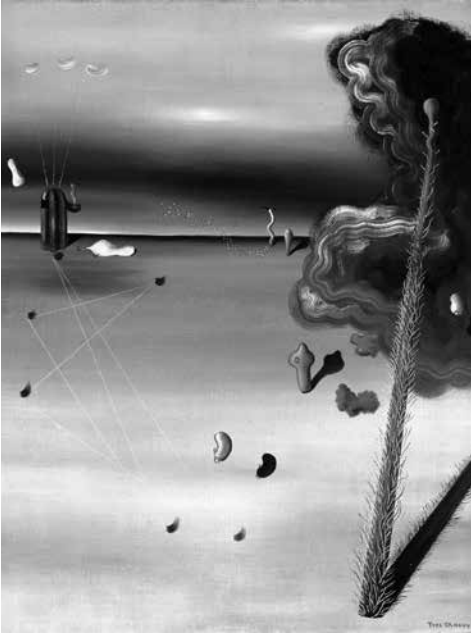
YVES TANGUY Mamá, papá está herido! 1927

ficación particular que atestigua el cargo, la dignidad de alguien”. Hoy, cualquier objeto considerado arte debe tener un título; es un elemento que efectivamente atestigua el