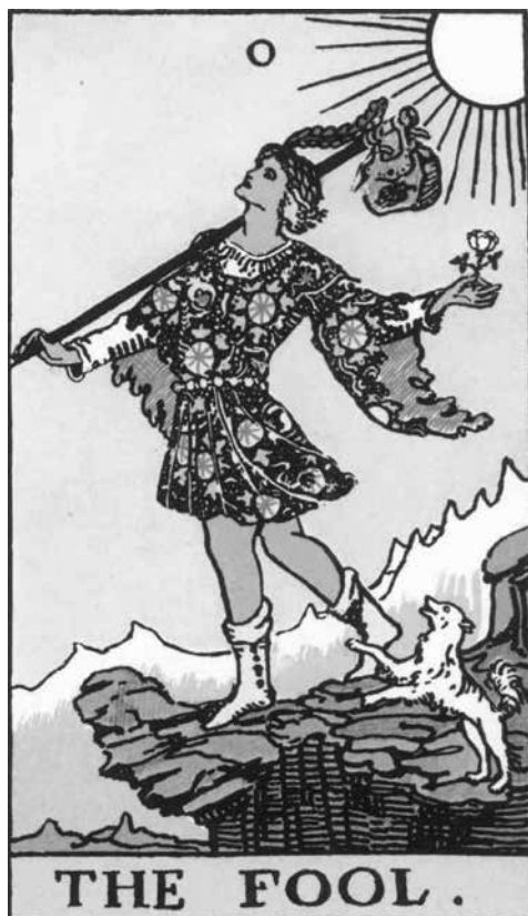
EL LOCO Del tarot Rider White